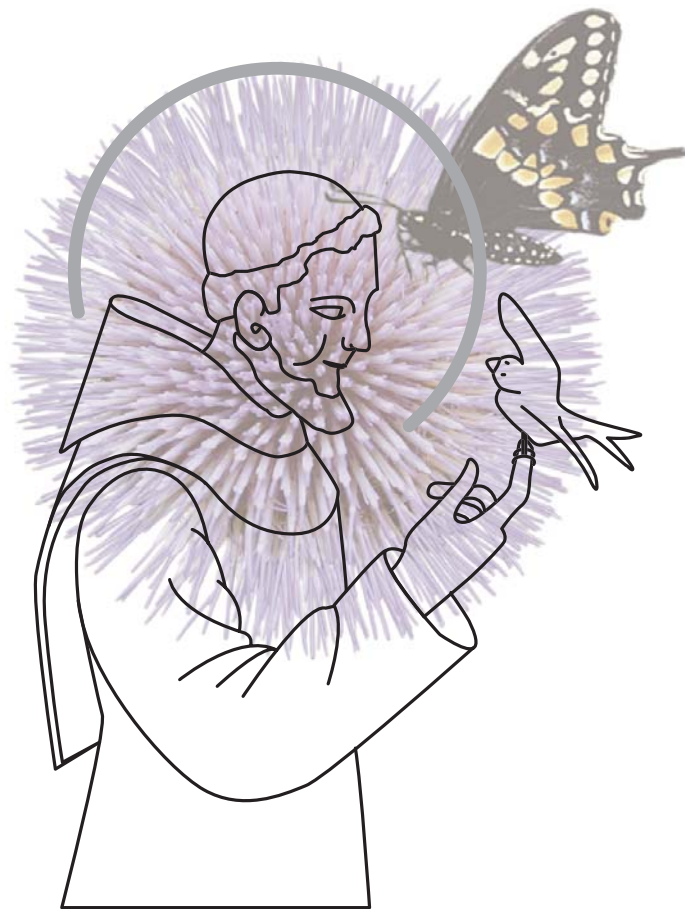
Franciscus van Assisi